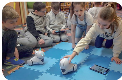
Zajęcia z programowania robotów Photon i Lego Minstorms