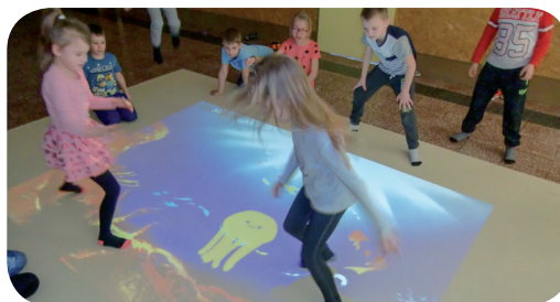
Dywan interaktywny na szkolnym korytarzu