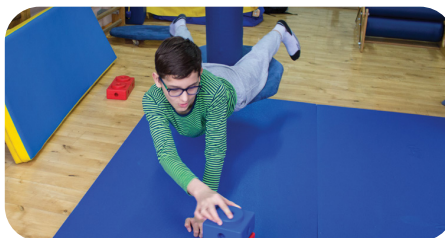
Sala do zajęć terapii integracji sensorycznej