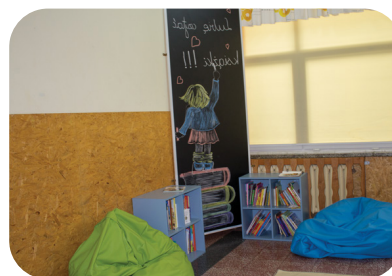
Kącki relaksacyjne i czytelnicze