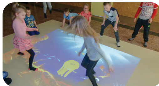
Dywan interaktywny na szkolnym korytarzu