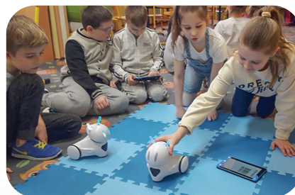
Zajęcia z programowania robotów Photon i Lego Minstorms